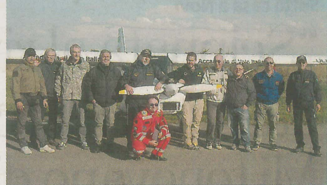
Foto di gruppo dei piloti dopo il superamento dell'esame

che realizzata una vasca di laminazione interrata in grado di garantire lo scarico nei momenti di massimo invaso, perché lì confluiscono le acque che arrivano dalla collina. È lunga circa 14 metri e in sommità ha una larghezza di più di 6 metri, quindi è in grado di smaltire le acque. I lavori sono stati eseguiti dall'impresa Marietta di Balangero per un importo di circa 180.000 euro e si aggiungono ad altri interventi di urbanizzazione da poco conclusi in piazza degli Alpini e in via Don Bosco, con una spesa di 750 mila euro, consentendo a chi abita nei condomini di via Don Bosco di raggiungere agevolmente viale Marchino. Un altro intervento di rilievo è stata la realizzazione del parcheggio a fianco dei condomini che fronteggiano l'istituto Sacro Cuore, con l'acquisizione di una cinquantina di nuovi posti auto. [F. N.]