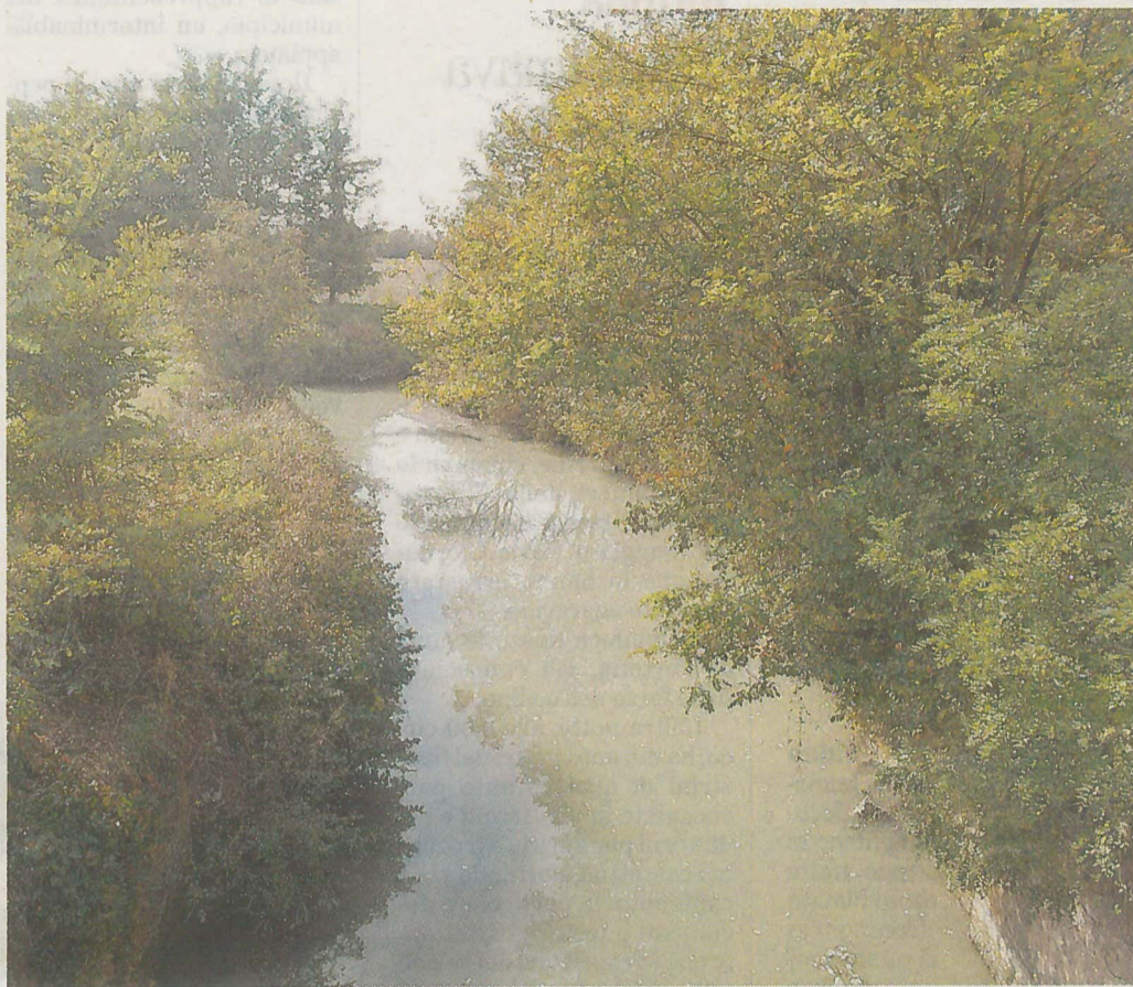
Il rio Gattola nel territorio di Frassineto: l'alveo va risagomato per aumentare la portata